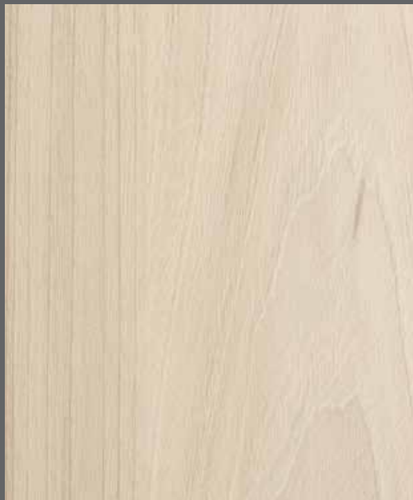
Soft Woodgrain | 9901 LRV 52