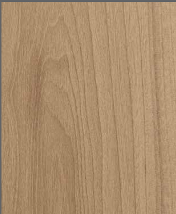
Warm Woodgrain | 9904 LRV 38