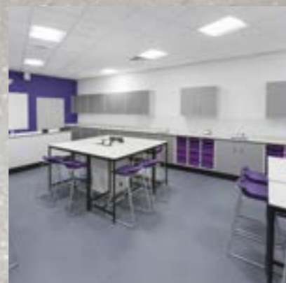
Altro XpressLay™: Klæbemiddelfrit sikkerhedsgulv

Til andre steder som fx spiserum, korridorer og indgangspartier, har vi en række sikkerhedsgulve , der passer til områderne.