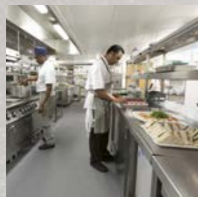
Altro Stronghold™ 30 / K30: Sikrer personalet fra at glide

Vi har også Altro Aquarius , et special-sikkerhedsgulv, der er designet til at forhindre, at man glider i våde og tørre omgivelser, og uanset om man har sko på eller bare fødder.