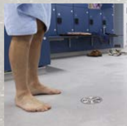
Altro Aquarius™: Sikre, attraktive badeområder